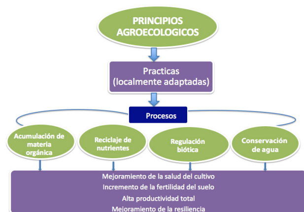
Figura 2. Principios y procesos agroecológicos para la conversión de los sistemas agrícolas.

* Cada número se refiere a un principio agroecológico enumerado en la Tabla 1